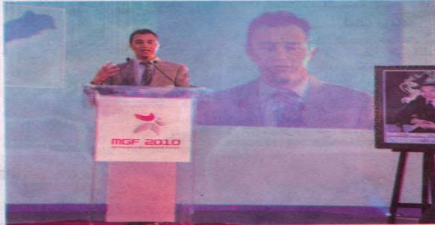
أحمد رضا الشامي وزير الصناعة والتجارة والتكنولوجيا الحديثة

أكثر من نصف المشاريع المقترحة تتعلق بخدمات عبر الخط موجهة إلى المواطنين ومن بينها مثلا الخدمات المتعلقة بالحالة المدنية والخدمات القنصلية أو خدمات التصريح بالضريبة على الدخل وأدائها. وإلى حدود العام الحالي بلغ عدد عمليات أداء الرسوم المحلية كما هو الحال بالنسبة لرسم السكن ورسم الخدمات الجماعية والرسم المهني، ما يعادل 4500 عملية وذلك إلى حين آخر فترة ضريبية، إلى جانب ذلك فإن خدمة متابعة تعويضات ملفات المرضى للصندوق الوطني لمنظمات الاحتياط الاجتماعي شملت ما مجموعه مليون و170 ألف مؤمن، وهو ما يشكل أزيد من ثلاثة ملايين مستفيد، ناهيك على أن الخدمات المتعلقة بالتقاعد شملت تسليم ما يعادل 52 ألف شهادة ومعالجة 345 ألف شكاية عبر الخط من طرف الصندوق المغربي للتقاعد، كما يتم عبر الخط تدبير وضعية أكثر من 98 ألف متقاعد و190 ألف منخرط من طرف النظام الجماعي لمنح رواتب التقاعد، كما سجل الصندوق المهني المغربي للتقاعد 286 ألف مستعمل، علما أنه تمت معالجة 9500 ملف لتصفية التقاعد منذ 2009.