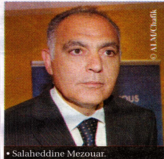
• Salaheddine Mezouar.