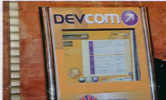
Avec 2 500 décideurs présents, la 1 re édition de Devcom a été un succès.

Les exposants ont fait un excellent travail qui correspond parfaitement à l'esprit de Devcom. Par ailleurs, il faut souligner que sur les 50 entreprises présentes, 80 % sont ma-