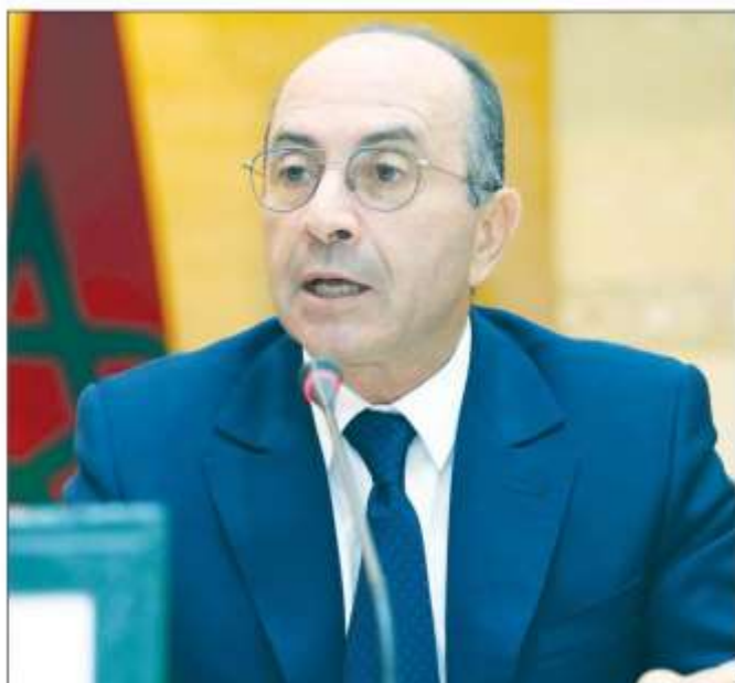
• Nouridine Bensouda, Trésorier Général du Royaume

La diminution des charges de la dette budgétisée s'explique par la baisse de 25,1% des remboursements du principal (22,8 MMDH) et par la hausse de 7,2% des intérêts de la dette (17,8 MMDH). Pour ce qui est des CST, ils ont réalisé des recettes de 54,9 MMDH, compte tenu des transferts reçus des charges communes d'investissement du budget général pour 12,5 MMDH et d'une recette de 3,5 MMDH au titre de la contribution sociale de solidarité sur les bénéficiaires et les revenus instituée par la loi de finances 2021. Les dépenses émises ont été de 43,4 MMDH. Le solde de l'ensemble des comptes spéciaux du Trésor s'élève à 11,5 MMDH. Coté SEGMA, leurs recettes ont augmenté de 13,5% à 923 millions de dirhams (MDH), tandis que leurs dépenses ont reculé de 22,5% à 468 MDH. ||