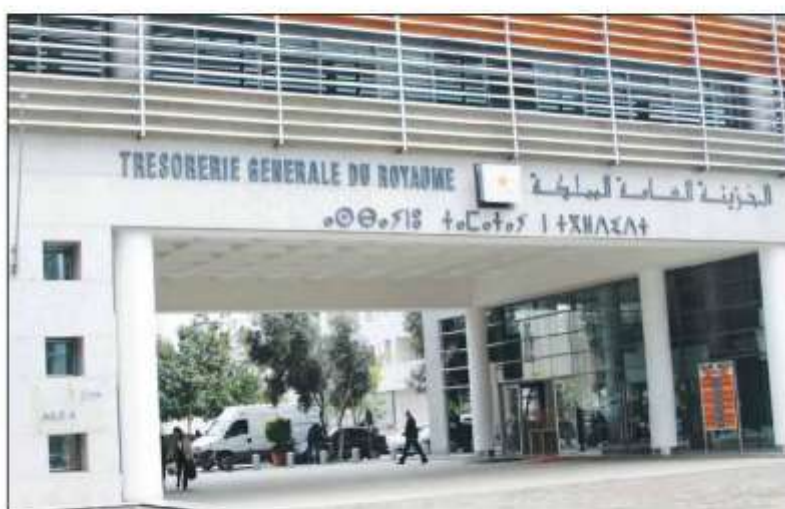
• Baisse des recettes ordinaires brutes

L a situation des charges et ressources du Trésor dégage un déficit budgétaire de 22,5 milliards de dirhams (MMDH) au titre des quatre premiers mois de cette année, contre un déficit de 3,4 MMDH à fin avril 2020, selon la Trésorerie Générale du Royaume (TGR). Ce déficit tient compte tenu d'un solde positif de 12,8 MMDH dégagé par les comptes spéciaux du