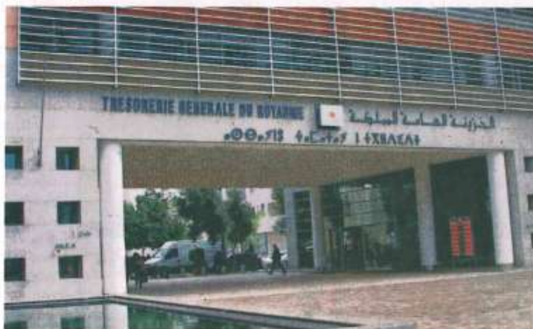
Les recettes des comptes spéciaux du Trésor ont atteint 50 milliards de dirhams.

Les engagements de dépenses, y compris celles non soumises au visa préalable d'engagement, se sont élevés à 307,5 milliards de dirhams à fin juillet 2018, représentant un taux global d'engagement de 58% contre 57% à fin juillet 2017. La diminution des charges de la dette budgétisée s'explique par le recul de 42,9% des remboursements du principal (17,7 milliards de dirhams contre 31 milliards de dirhams) et la hausse de 0,9% des intérêts de la dette (17,8 milliards de dirhams contre 17,7 milliards de dirhams), fait-elle remarquer.